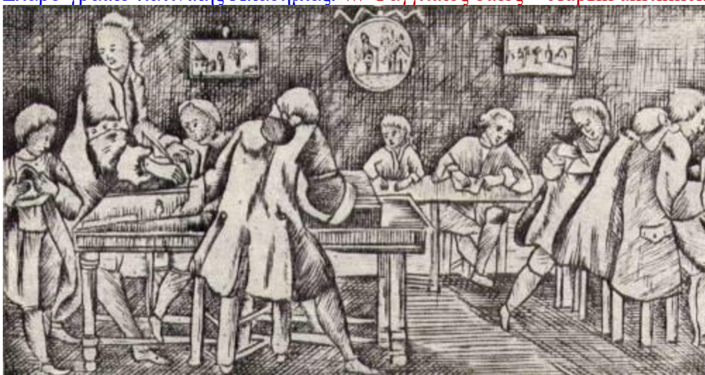
Обучение в Славяно-греко-латинской академии / Φοίτηση στις εγκαταστάσεις της Σλάβο-γραικο-λατινικής Ακαδημίας.

ГРЕЧЕСКИЙ КУЛЬТУРНЫЙ ЦЕНТР Москва, Алтуфьевское шоссе, 44 офис № 9, 2 этаж Тел.: 7084809 – Тел./Факс: 7084810