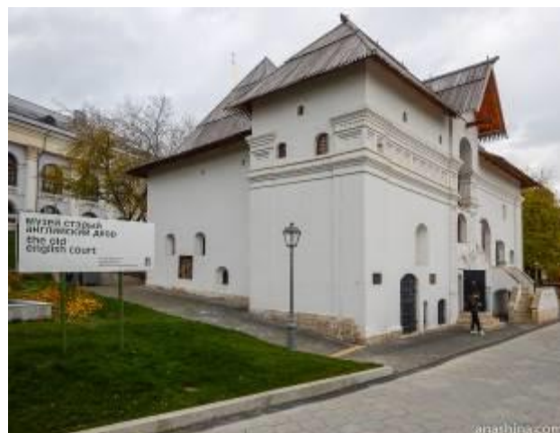
Привилегия на Академию (учредительный документ Академии) / Το ιδρυτικό έγγραφο της Σλάβο-γραικο-λατινικής Ακαδημίας. /// Οαγγλικός οίκος – старый английский двор